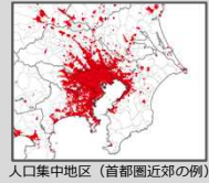
人口集中地区（首都圏近郊の例）

https://www.mlit.go.jp/koku/koku_fr10_000041.html https://www.mlit.go.jp/en/koku/uas.html