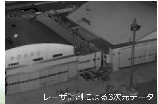
レーザ計測による3次元データ